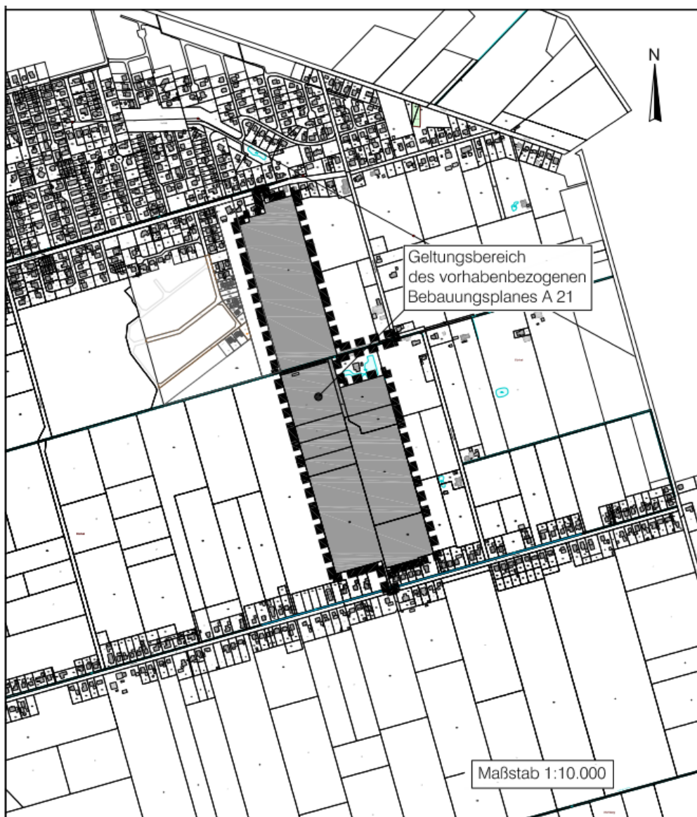
Übersichtsplan Bebauungsplan A 21 „Solarpark Nord“ kein Maßstab

Auf die untenstehenden Übersichtspläne wird hingewiesen. Der jeweilige Geltungsbereich ist den Übersichtsplänen zu entnehmen.